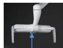
Zona di funzione del sensore

LOLé si riaccenderà al livello in cui era stata impostata precedentemente.