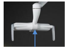
Zone de détection du capteur

LOLé se rallumera au niveau auquel il aura été éteint précédemment.