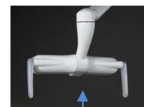
Zone de détection du capteur

LOLé se rallumera au niveau auquel il aura été éteint précédemment.