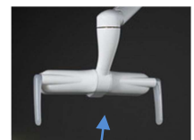
Detektions-bereich der Zelle

Bei erneutem Einschalten ist die Lichtstärke die Gleiche wie vor dem Ausschalten.